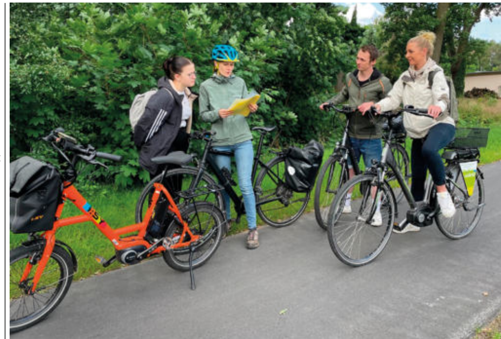
Jeder geradelte Kilometer spart nicht nur CO 2 , sondern bringt Vorteile für die Gesundheit und wichtige Informationen für die Entwicklung des Radwegenetzes.

KfW, Palmengartenstraße 5 – 9 60325 Frankfurt am Main www.kfw.de Hotline Bauen, Sanieren und Wohnwirtschaft: Tel.: 0800 539 9002