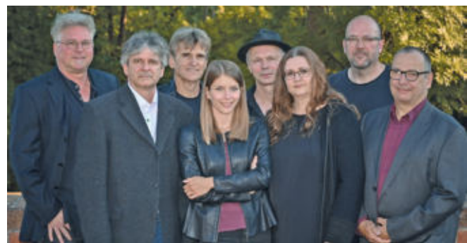
The Marmeltears bringen Werke von Künstlern auf die Bühne, die die Musikgeschichte geprägt haben und nicht mehr leben.

gemeinsames Musikerlebnis, bei dem nicht Perfektion, sondern die Freude am Singen zählt. Die Texte werden per Beamer auf eine Leinwand projiziert. Tickets für die Veranstaltungen sind online über Reservix, in der Gäste-Information der Burg Storkow sowie an Vorverkaufsstellen.