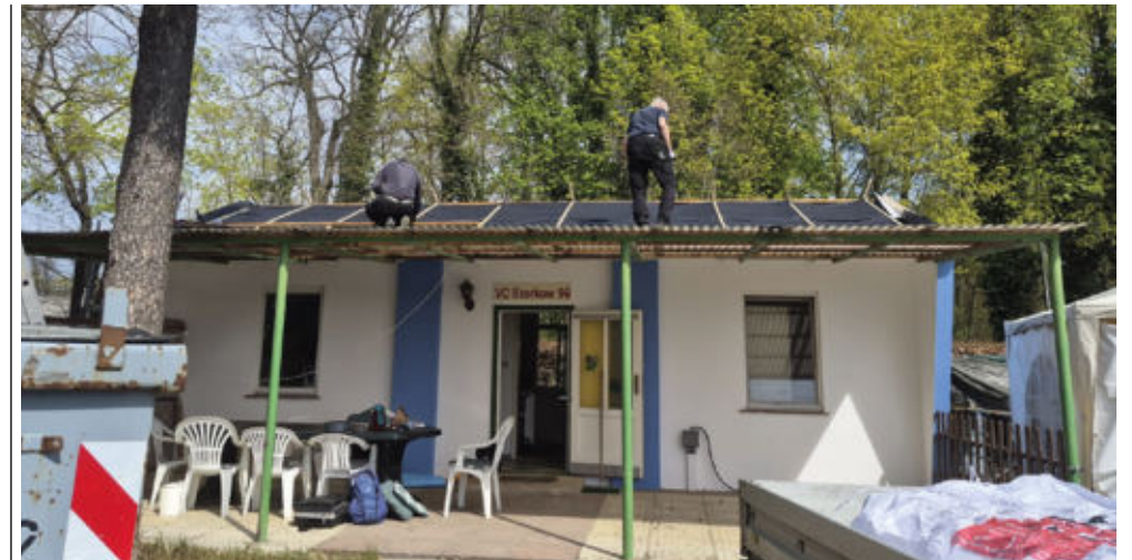
Das Dach des Vereinsheims des VC konnte dank Spende erneuert werden.

Die Jagdgenossenschaft weist darauf hin, dass eine Übertragung des Stimmrechts durch schriftliche Bevollmächtigung möglich ist. Die Vollmacht ist vor Beginn der Versammlung dem amtierenden Vorstand vorzulegen. Der Vorstand freut sich auf eine rege Teilnahme der Mitglieder. (pm)