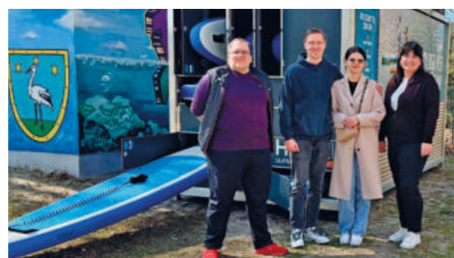
Bei der Inbetriebnahme der SUP-Station in Karlslust.

Weitere Infos sind auf der Website des Verleihers zu finden: https://heiuki.com/