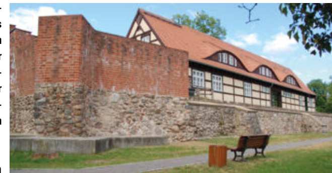
In der Burg Storkow befindet sich die Stadtbibliothek

Was einst mit wenigen Regalen und einer kleinen Leserschaft begann, entwickelte sich über die Jahrzehnte zu einem wichtigen Anlaufpunkt für Generationen von Leserinnen und Lesern. Die Bibliothek erlebte zahlreiche Umzüge, bauliche Herausforderungen und gesellschaftliche Veränderungen – von provisorischen Unterbringungen über technische Neuerungen bis hin zur heutigen Unterbringung im historischen Ambiente der Burg Storkow. Dabei blieben die