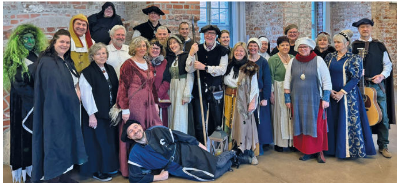
Die Storkower „Gefährten der Nacht“ suchen Mitstreiter, die Interesse an Geschichte und Schauspiel haben.