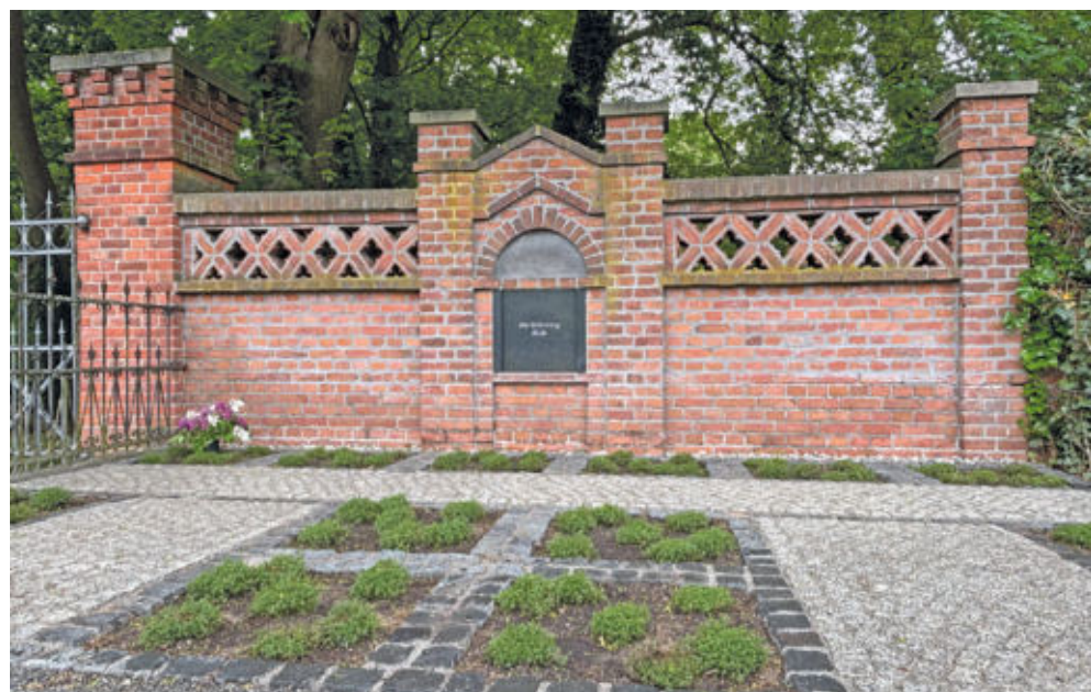
Auf dem Storkower Friedhof wurde eine weitere Urnenmauer-Grabanlage mit 14 neuen halbanonymen Grabfeldern fertiggestellt.

Bei Fragen zu den einzelnen Bestattungsformen oder Friedhofsangelegenheiten berät Frau Linke von der Friedhofsverwaltung der Stadt Storkow (Mark) gern. (svs)