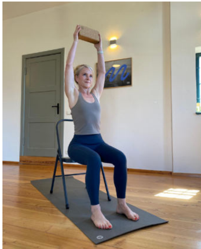
Yoga auf dem oder am Stuhl ist besonders gelenkschonend.

Der nächste Kurs startet am 12. Juni und läuft acht Wochen, immer freitags von 14:30 bis 15:30 Uhr. Er kostet 150 Euro, eine Bezuschussung durch die Krankenkassen ist möglich. Mitzubringen ist bequeme Kleidung, in der man sich gut bewegen kann. Es fragte: Dörthe Ziemer Weitere Infos über yogakim.de oder per Mail: kim@yogakim.de.