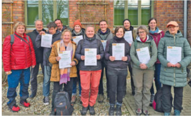
Die neuen Naturführer mit ihren Zertifikaten

Der inhaltliche Bogen des Kurses spannte sich von didaktischen Modulen und den großen Themenbereichen wie Geologie, Archäologie, Ökologie, Nachhaltige Entwicklung, Vermarktungsmöglichkeiten und Rechtsfragen bis hin zur Vorstellung wichtiger Partner in den Regionen. Die Naturführerinnen und Naturführer zeigten, dass sie als Botschafterinnen und Botschafter ihrer Regionen mit kreativen Ideen und frischen Führungskonzepten in die Saison starten können. Damit bereichern sie die Angebote in den Bereichen Natur-