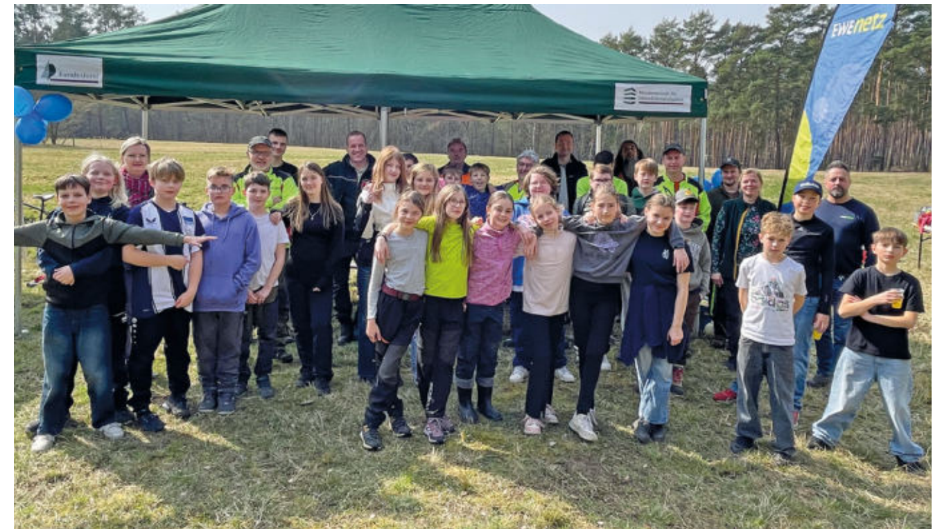
Gemeinsame Baumpflanzaktion von EWE NETZ, Europaschule Storkow und dem Bundesforstbetrieb Havel-Oder-Spree.