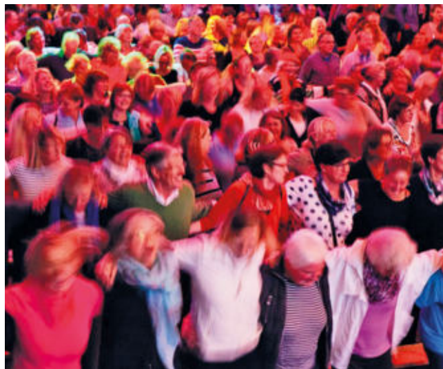
Beim Rudelsingen zählt vor allem der Spaß.

Am 14. August um 20 Uhr ist der Sänger und Autor Hans-Eckhardt Wenzel mit Band zu Gast. Seine Lieder verbinden poetische Texte mit einer klaren musikalischen Haltung und greifen Themen der Gegenwart auf.